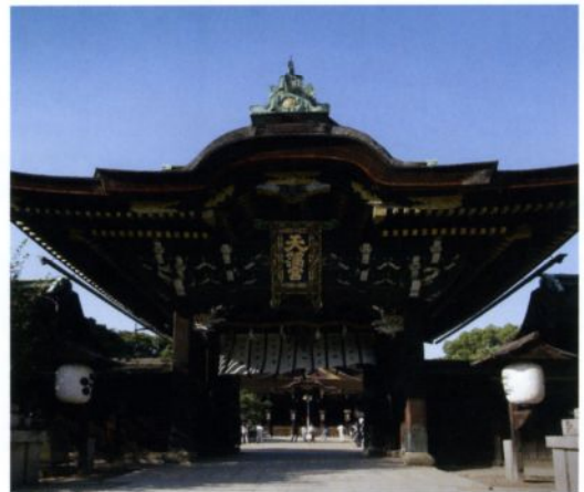
D 北野天満宮 (きたのてんまんぐう)

嵐電(北野線)北野白梅町駅 より徒歩約5分 京都市上京区馬喰町 ☎075-461-0005 ●拝観時間【夏季】5:00~18:00 【冬季】5:30~17:30 ●拝観料 境内無料 ●休み なし http://www.kitanotenmangu.or.jp/