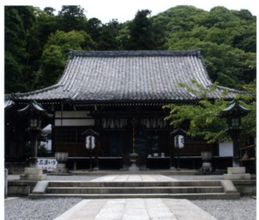
F 虚空蔵法輪寺 (こくうざうほうりんじ)

嵐電(嵐山本線)嵐山駅 より徒歩約7分 京都市西京区嵐山虚空蔵山町68-3 ☎075-861-0069 ●拝観時間 9:00~17:00 ●拝観料 無料 ●休み なし http://www2.ocn.ne.jp/~horinji/